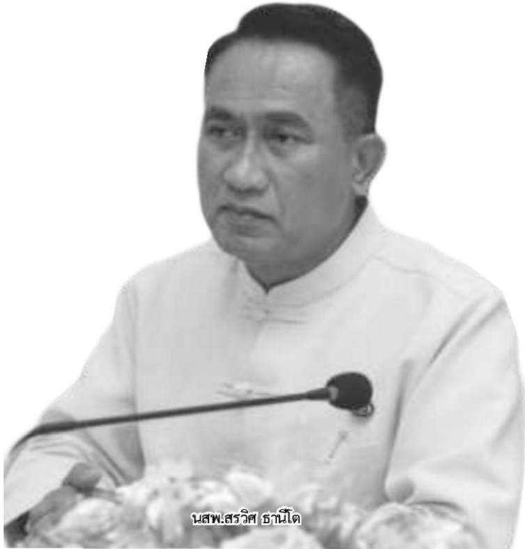
นสพ.สรวิศ ธานีโต

หัวข้อข่าว: ปศุสัตว์คุมเข้ม'อหิวาต์แอฟริกา'ในสุกรกับมาตรการป้องกันการระบาดใน'ไทย'