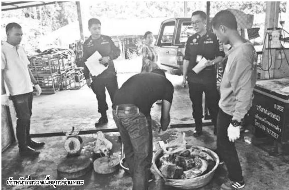
เจ้าหน้าที่ตรวจเนื้อสุกรชำแหละ

แม้จะไม่ระบาดสู่คน แต่ก็ส่งผลต่อเศรษฐกิจ ของประเทศสำหรับการระบาดของโรคอหิวาต์แอฟริกาในสุกรหรือ ASF (AFRICAN SWINE FEVER) ที่ปัจจุบันพบว่ามีกรแพร่ระบาดขยายเป็นวงกว้างขึ้นอย่างต่อเนื่อง เป็นโรคระบาดที่รุนแรงและรวดเร็วในสุกร ทั้งยังไม่มียุทธศาสตร์ป้องกันและไม่มีการรักษา เนื่องจากเชื้อไวรัสมีความทนทานทำลายยาก อยู่ในเลือด เนื้อใน นอวัยยะหรือแม้แต่ในแหวนมโนไส้กรอก แต่ก่อโรคในหมูและหมูป่าเท่านั้น ไม่ติดสัตว์ชนิดอื่นและไม่ติดคน หากพบการระบาดของโรคดังกล่าวจะสร้างความเสียหายทางเศรษฐกิจทั้งทางตรงและทางอ้อม